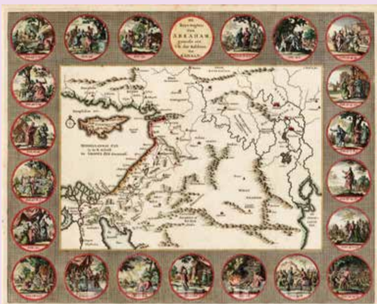
Historische kaart, 'De Reys-togten van Abraham gaande uit Ur der Kaldeen na Kanaan'